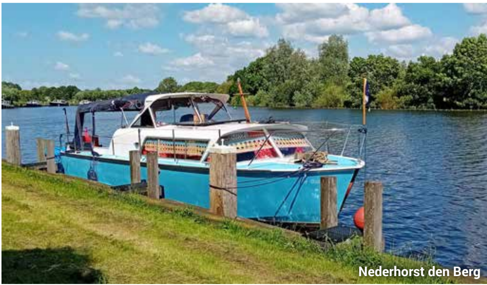
Nederhorst den Berg

Om bij het wegvaren te voorkomen dat mijn kont tegen de muur komt, heeft zoonlief gezegd, moet ik het stuur naar de muur draaien, een klein beetje gas geven en gelijk de andere kant weer opdraaien. Eitje, dat gaat gesmeerd. Waar is het publiek als het wel goed gaat, denk ik dan.