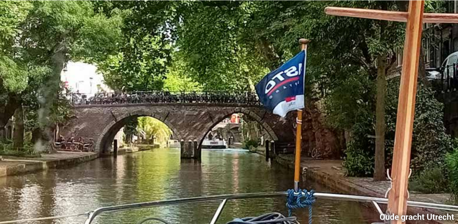
Oude gracht Utrecht