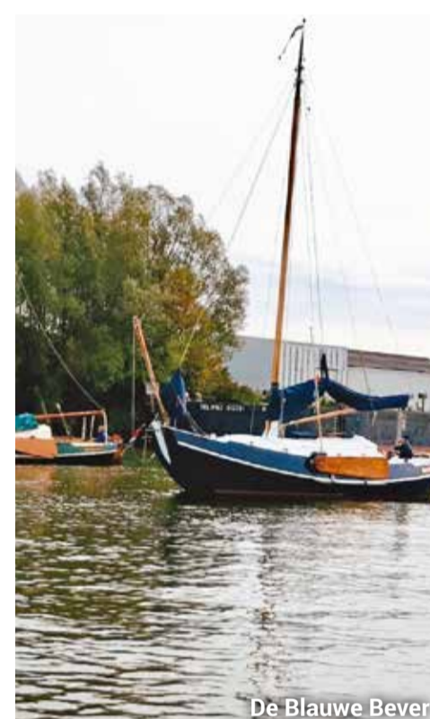
De Blauwe Bever

Joop/Riet: Ik heb een uitgebreid vaargebied wat ik leuk vind. Ik zeil graag in Zeeland. Ik heb met een Kelt 800 een mooie oversteek mogen maken naar Engeland. Ik vind de grote rivieren leuk en houd een apart plaatsje vrij voor de Gelderse IJssel. Stadjes bezoeken en varen op stroom is gewoonweg heel erg leuk. Ik vaar graag met mijn vrouw en mijn kinderen zijn altijd welkom aan boord. Mijn dochter Lieke vaart een motorboot en komt graag langs. Altijd gezellig. We varen een gipon K&V grondel van 8m50. Een zailig ruim schip. Wij vinden het ook een heel mooi schip en met een diepgang van 80 centimeter is het een prima schip om ook de kleine krekens in de Biesbosch te bezoeken. Vaak wordt de boot door anderen gefotografeerd. Blijkbaar toch een schip wat opvalt. Zeilen geeft rust en... je hebt met een platbodem altijd wat langer de tijd om van zon, wind en water te genieten. Je maakt op het water natuurlijk van alles mee en ook wij hebben wij wat 'stuipen' meegemaakt op het water. Gelukkig nooit levensbedreigend, maar als je op de Grevelingen vaart met een lekkende schroefas ben je toch blij dat je snel voor een goede reparatie de wal op kan. Ik weet uit ervaring inmiddels ook dat, als je een klagpij moet opvangen op het Noordzeekanaal (omdat je moet wijken voor een zeeschip wat uit een zijhaven komt), de blaren in je handen staan. Dat geneest gelukkig allemaal snel. We hebben voor onze boot een fijn plekje gevonden bij WSV Geertruidenberg.